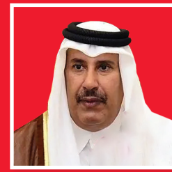
افشای مقام قطری درباره پروژه براندازی نظام سوریه