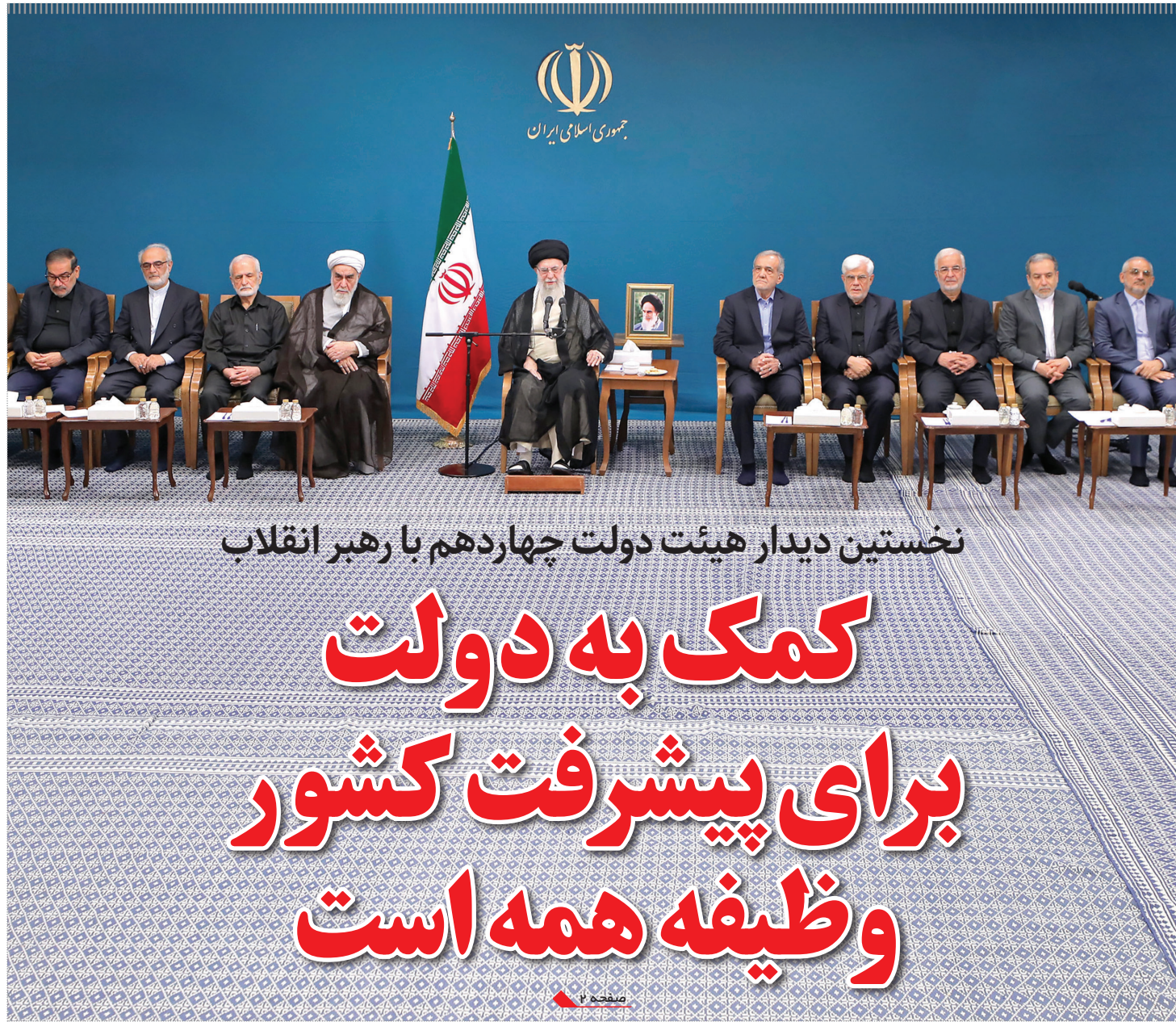
نخستین دیدار هیئت دولت چهاردهم با رهبر انقلاب