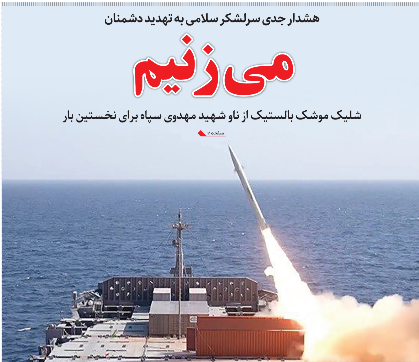
هشدار جدی سرلشکر سلامی به تهدید دشمنان

حالا تکلیف کشور، مجلس قوانین و مردم چه می‌شود؟! صفحه ۸