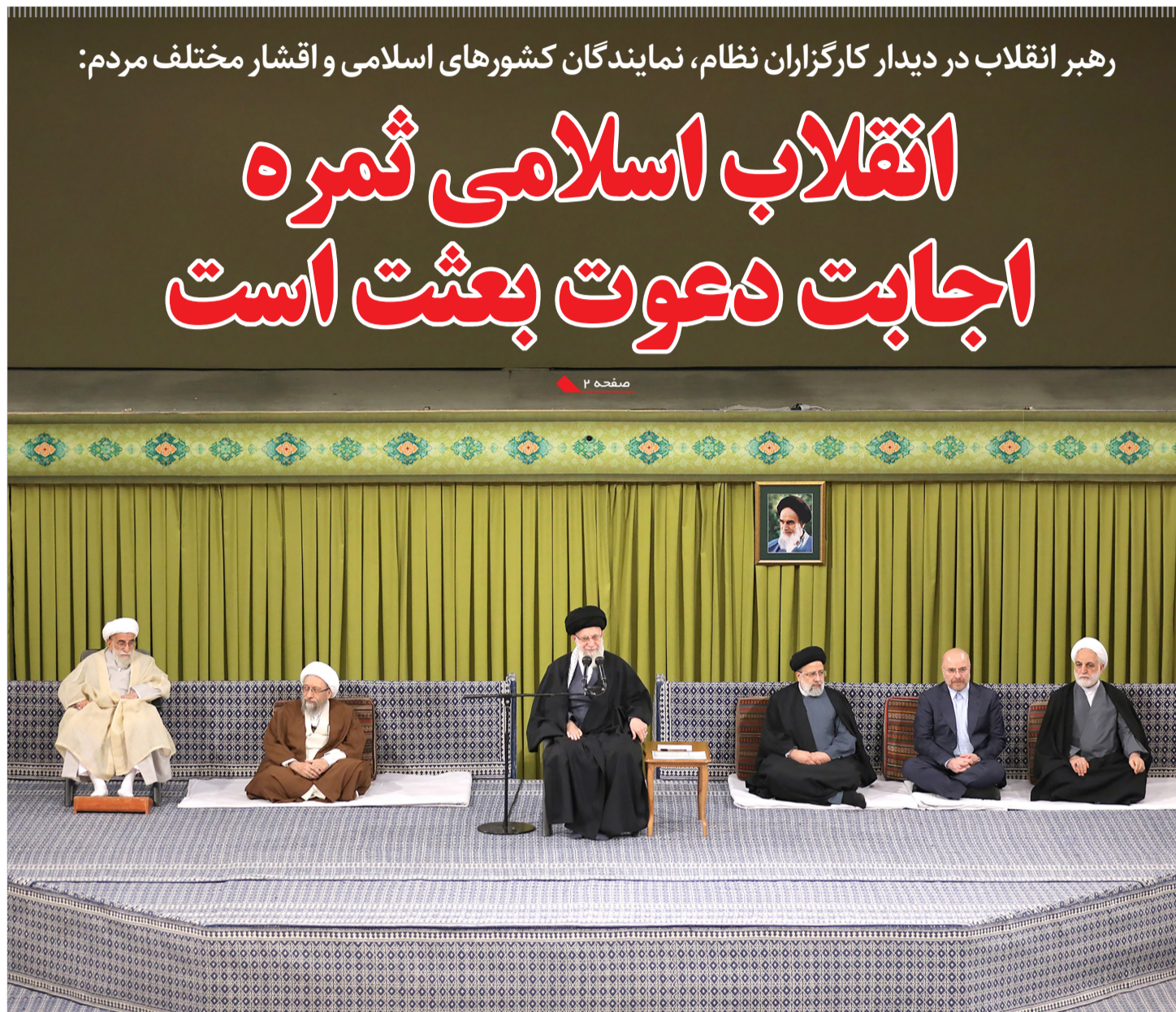
رهبر انقلاب در دیدار کارگزاران نظام، نمایندگان کشورهای اسلامی و اقشار مختلف مردم: