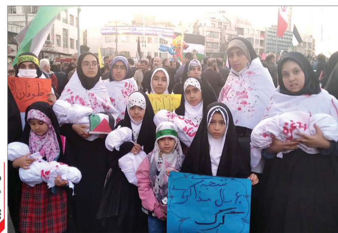
عکس سیاست روز

گروه سیاسی - میترا یزدچی - روز گذشته بار دیگر مردم همیشه در صحنه و هوشیار ایران در محکومیت اقدامات رژیم کودک کش صهیونیستی در تهران و دیگر شهرهای کشور به میدان آمدند و یکصد فریاد مرگ بر اسرائیل سر دادند. دیروز میدان انقلاب و خیابان‌های اطراف آن شاهد حضور گسترده مردم تهران در حمایت از مردم مظلوم غزه بود. آنها دوشادوش هم و با مشت‌های گره کرده مرگ بر اسرائیل و مرگ بر آمریکا سر دادند. در این میان حضور جوانان، نوجوانان، کودکان و حتی نوزادان ایرانی شایان توجه بود. نوجوانان و جوانان ایرانی همواره در رویدادهای مهم حضور داشته و نشان داده‌اند با اخبار و حوادث اطراف شان بیگانه نیستند. برگزاری ایستگاه‌های فرهنگی - هنری کودکان و نوجوانان و اجرای سرود و برنامه‌های فرهنگی اقدام دیگری بود که در این راهپیمایی نقش متمایز و ویژه به کودکان و نوجوانان داده بود. گروهی از دختران دبستان منطقه ۱۸ نیز با پوشیدن کفن و در دست گرفتن نمادین نوزدان کفن پوش در این راهپیمایی، بمباران غزه و کشتن کودکان فلسطینی را محکوم کرده و درباره علت حضورشان در این راهپیمایی گفتند: ما به این راهپیمایی آمدمیم تا به کودکان فلسطینی بگوییم تنها نیستند و ما در هر شرایطی کنار آنها می‌مانیم.